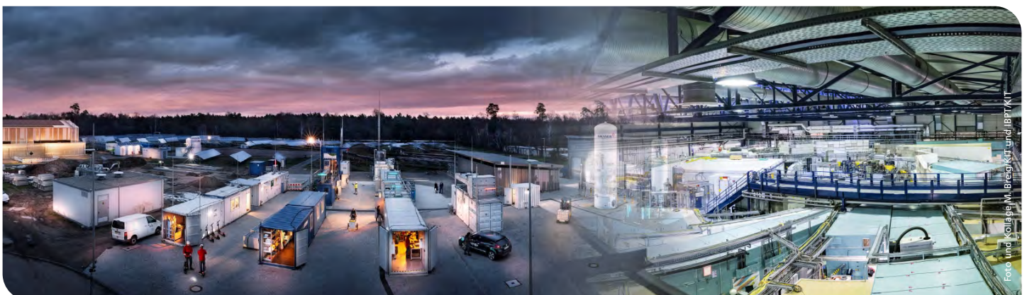
KITTEN vereint zwei große Forschungsinfrastrukturen des KIT – das Energy Lab (links) und die Beschleunigertestanlage KARA (rechts).

Die in KITTEN eingebrachte Expertise reicht von der Systemanalyse bis zur Entwicklung fortschrittlicher Komponenten. Beteiligte Wissenschaftlerinnen und Wissenschaftler entwerfen hocheffiziente mikrostrukturierte Stromzuführungen für Hochstromanwendungen und sind führend in der Entwicklung von hochtemperatur-supraleitenden Materialien und Magnetsystemen. Außerdem treiben sie kompakte, lichtgetriebene Beschleunigertechnologien voran.